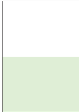
1/2 Seite quer 210 × 148,5 mm (+3 mm Beschnitt) CHF 3000.–