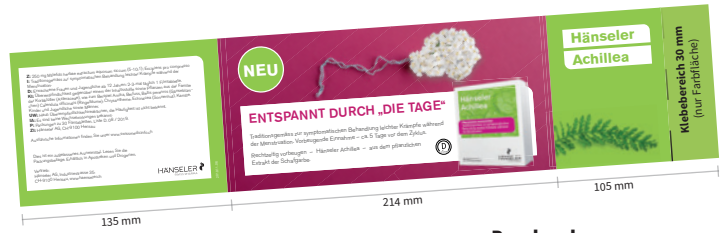
Banderole CHF 6100.–